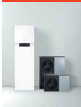
Vitocal 222-S: Unutrašnja jedinica (levo) i spoljašnje jedinice (desno)